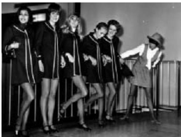
Mary Quant y sus modelos en minifalda

sociales, la intolerancia, el racismo y la guerra.