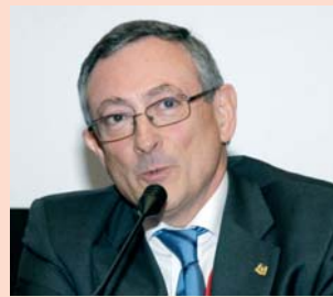
D. Enrique Polanco GRUPO PRISA