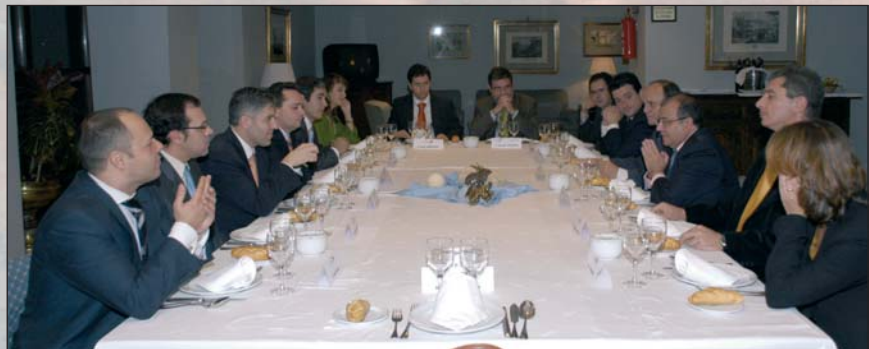
Cena DINTEL durante TECNIMAP, en el Parador de Gijón, con debate patrocinado por McAfee sobre "El CISO en las AA.PP."

El escaparate de la calle nos deslumbró. La verborrea y refranero