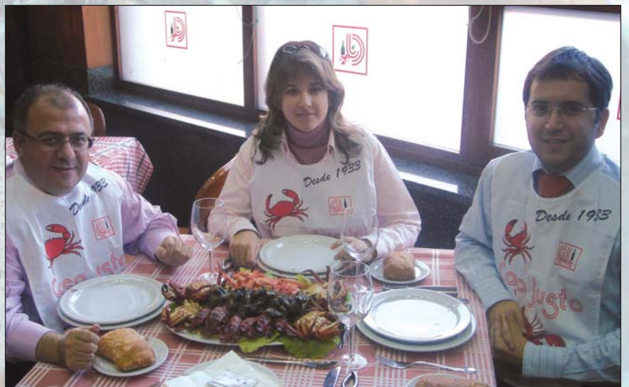
Atribulados ex-TECNIMAPENSES, de aquel "viernes de dolores" (de cartera)