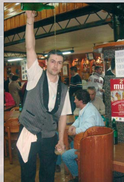
Asturies, sin un "culín de sidra", no "presta" tanto

Un restaurante sidrería, que sí me permito recomendarles por su relación calidad-precio, es el San Bernardo IV , en el número 4 de la calle San Bernardo, justo (no se asusten, no es el "nombre propio" de antes, sino la preposición) al comienzo de la misma, nada más salir de la Plaza Mayor de Gijón, donde se encuentra el Ayuntamiento. Si se deciden por un buen centollo, oricios ,... mejor que llamen antes para reservar sitio (no es grande el local y siempre tienen clientes... como yo, por ejemplo, cada vez que voy a Gijón) y "animal" (las tallas grandes son las que antes se agotan). Denle recuerdos de mi parte a cualquiera de los amables camareros que atienden la barra... en especial a mi